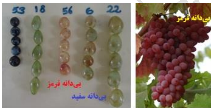
نمونه‌های از ارقام شاهد و بی‌دانه قرمز جهت مقایسه با رقم مینودر

پوست ضخیم حبه، اتصال خوب حبه به خوشه و مناسب برای عرضه خارج از فصل و تحمل بهتر سرمای زمستانه و زود گل. بیشتر مناطق انگور خیز کشور به‌ویژه مناطق با زمستان سرد، فصل رشد طولانی، درجه حرارت بالا و رطوبت نسبی پایین در تابستان و فصل رشد عاری از بارندگی آخر فصل برای ترویج این رقم مناسب می‌باشد.